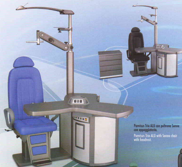
Panvisus Trio ALU con poltrona Sonne con appoggiatesta.