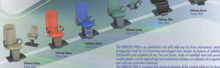
Panvisus Trio ALU with Sonne chair with headrest.

The PANVISUS TRIO is an ophthalmic unit with table top for three instruments, which distinguishes itself by its harmonious and elegant style, besides its features of stability, functionality and simplicity of use. The unit frame, made of modelled steel and curved wooden panels, and the applied high level mechanical solutions are indicative of a superior and exclusive production technique.